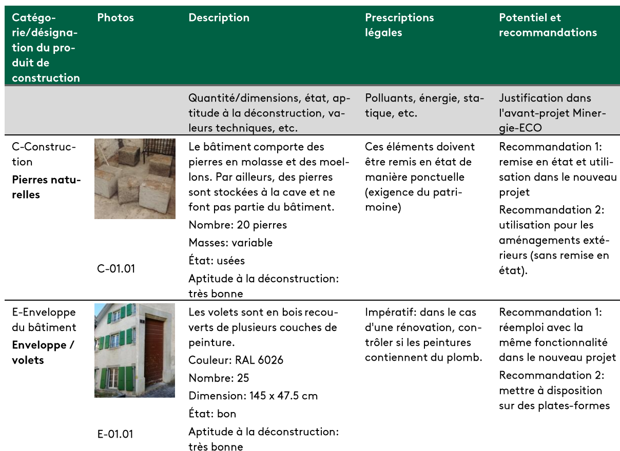
Tableau 4: Exemple de saisie à l'aide de la «Liste des éléments de construction, analyse des potentiels de construction circulaire», voir le modèle Excel.

Le graphe 2 représente les différentes utilisations après déconstruction de manière simplifiée: